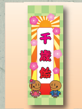
『木魚のぽっくん』 オリジナル風船