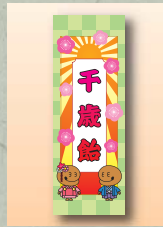
『木魚のぽっくん』 オリジナル風船